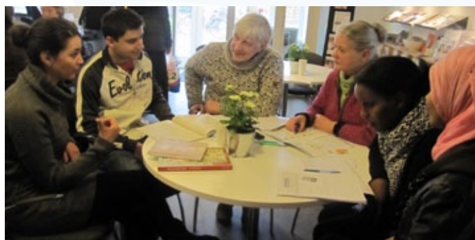
Sprog- og netværkscafeen i frivilligcentret var i 2014 blandt modtagerne af §18-midlerne

Hvis din forening, organisation eller gruppe laver arbejde eller planlægger aktiviteter, der lever op til tildelingskriterierne for en af de to puljer, kan der søges om økonomisk tilskud ved at udfylde et ansøgningskema og sende det til kommunen.