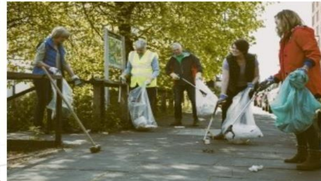
Frivillig social området