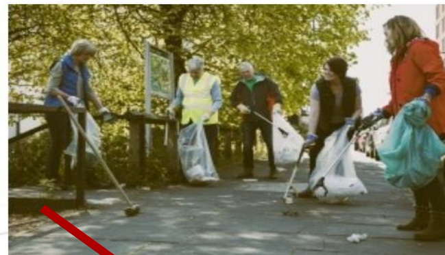
Frivillig social området